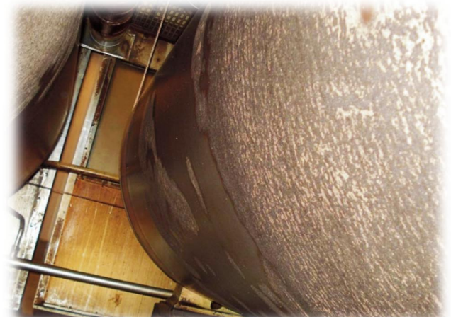
Avant : surfaces de cylindres très encrassées

Les opérateurs sont satisfaits du nettoyage. EV ReDoc a éliminé la saleté qui s'était accumulée avec les années sur les surfaces de cylindre et de calandre. Grâce aux surfaces propres de cylindre, le séchage est plus efficace et nécessite moins d'énergie. De plus, la qualité du carton est meilleure. Après le nettoyage, les surfaces du cylindre restent propres après une année de production.