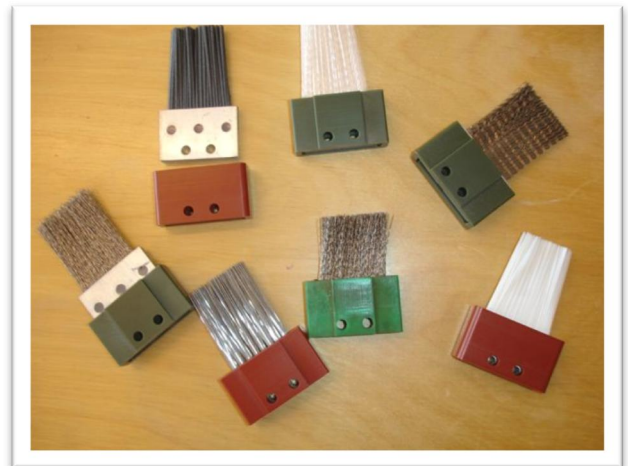
Types de brosses EV ReDoc

La pression de ligne à travers la surface du cylindre / rouleau est ajustée avec l'unité d'ajustement précis de l'EV ReDoc. C'est pourquoi même des cylindres anciens et usés peuvent être nettoyés efficacement grâce au système EV ReDoc, quand un système de doctorage conventionnel ne parvient pas à maintenir les cylindres propres.